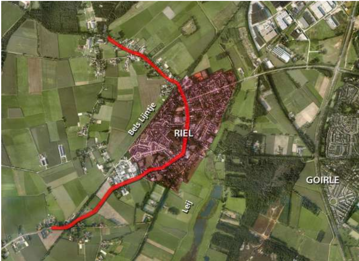
Figuur 1 Het dorpslint Riel